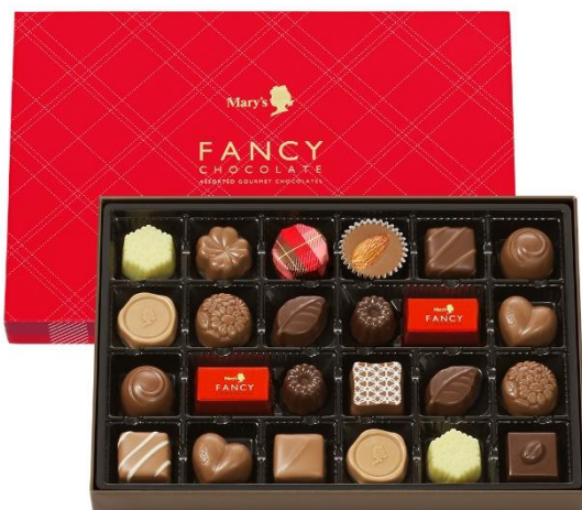
ファンシーチョコレート 24個入

この総選挙は、ファンの皆様が「推し」を表明する機会でありながら、推しチョコレート以外の良さにも気づいていただける企画であり、ひと粒ひと粒の個性を知ることにより、グループとしてのファンシーチョコレートの魅力をさらに感じていただけることを願い企画しました。