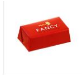
アーモンドクランチ