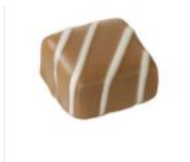
クッキー&クリーム

バニラが香るホワイトチョコレートにココアクッキーを加えたサクサク食感。 ※クッキー2.6%使用