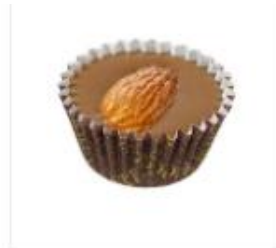
アーモンドカップ