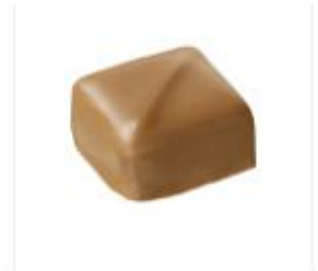
クリスピージャンドゥーヤ

ジャンドゥーヤにモルトパフを加えて軽やかに仕上げました。 ※ヘーゼルナッツペースト4.1%使用